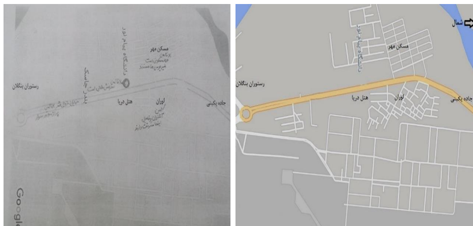
شکل ۱: نقشه بخش شمالی شهر

در شکل‌های (۱) و (۲) نقشه جغرافیایی مناطق شمالی و جنوبی شهر جاسک مشاهده می‌شود که از سایت گوگل‌مپ ۱ بر اساس آخرین داده‌های ماهواره‌ای دانلود شده است و در اختیار پاسخگویان به منظور مشخص نمودن فضاهای امن و ناامن شهری، قرار گرفته است که نمونه تکمیل شده توسط یکی از پاسخگویان نیز به همراه نسخه اصلی مشاهده می‌گردد.