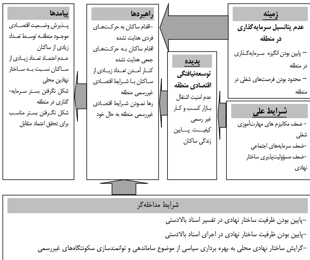
شکل ۲: مدل پارادایمی